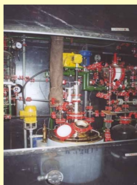
ФРАГМЕНТ ОДНОГО ИЗ МОДУЛЕЙ УСТАНОВКИ СИНТЕЗА ПЕФЛОКСАЦИНА